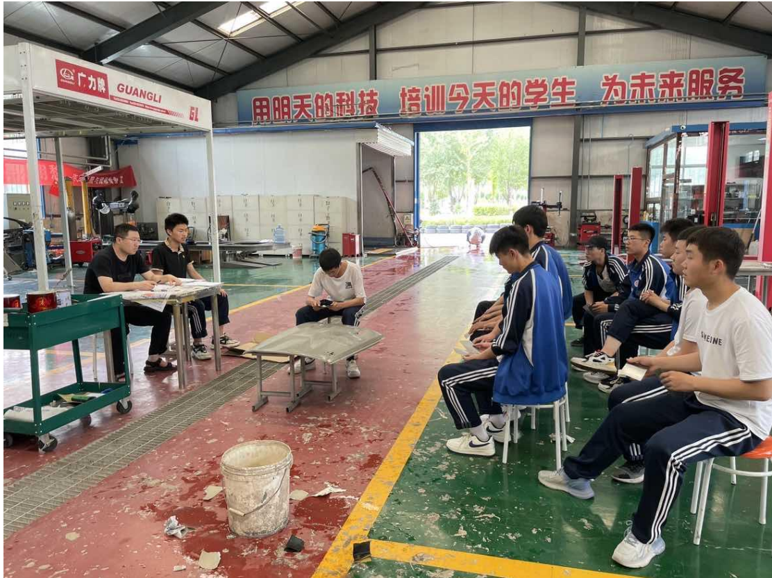
2.1-1 汽车修理专业课教学

专业实训条件良好。加大投入，2023年新建实训室3个，实训设备和实训工位等均能满足教学需要。