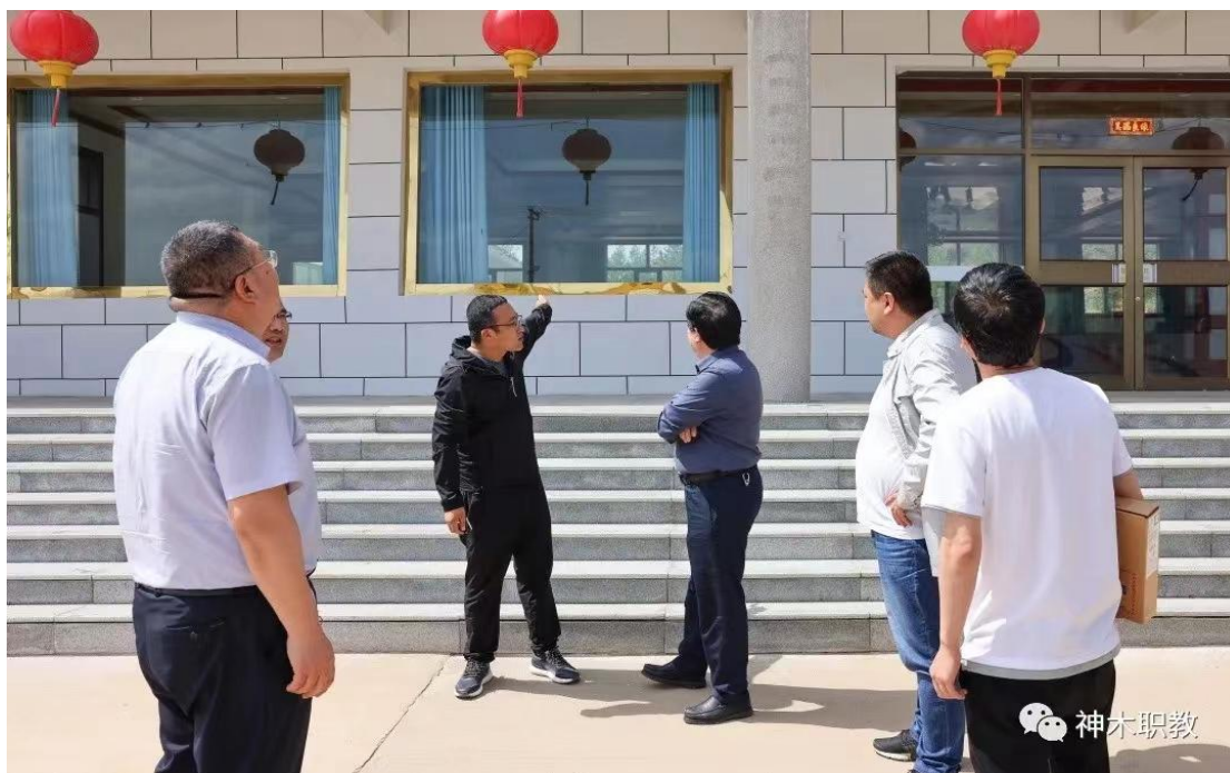
3.3-1 服务乡村振兴帮扶锦界镇黄土庙村